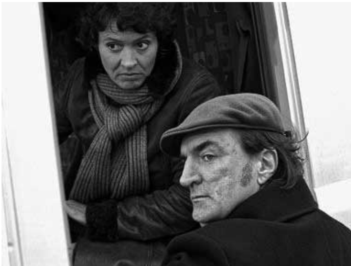
Immer am Tatort: Andreas Hoppe und Ulrike Folkerts