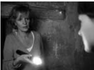
„Kommissarin Lucas, guten Abend. Und wer sind Sie?“