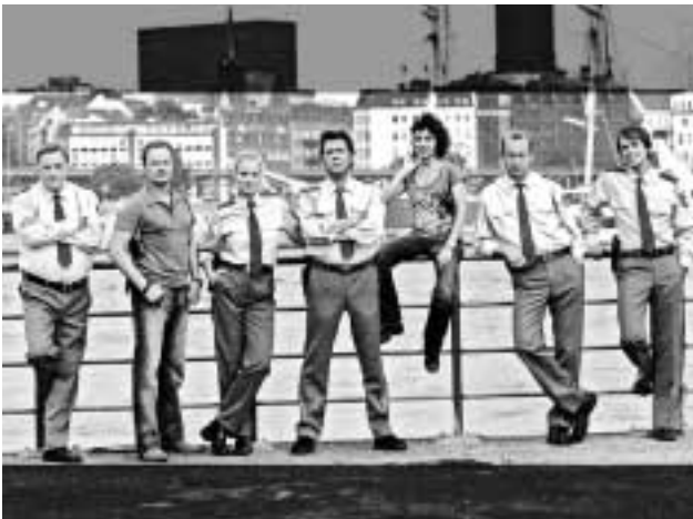
„Großstadtrevier“: The Magnificent Seven statt der Wilden 13

ELVIS UND DER KOMMISSAR, Serie GROSSSTADTREVIER, Serie