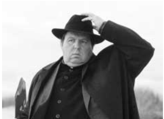
All that heaven allows: Pfarrer Braun

K-3 – EINSATZ HAMBURG, Reihe DIE KOMMISSARIN, Serie MORD MIT AUSSICHT, Serie PFARRER BRAUN, Reihe