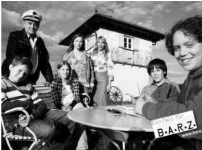
B.A.R.Z. - Die Abkürzen stehen für die Namen der Kids

ADELHEID UND IHRE MÖRDER, Serie COMMISSARIO LAURENTI, Reihe DONNA LEON, Reihe DIE DETEKTIVIN, Serie EIN FALL FÜR B.A.R.Z., Kinderkrimi-Serie (+ KIKA)