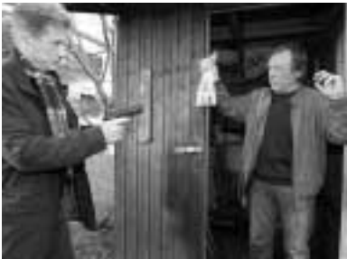
Jürgen Prochnow, Claus Theo Gärtner – 120 Jahre im Dienste des ZDF