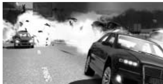
Cobra 11: Brauchbare Stories, so lange sie dem Verschrotten von Autos nicht im Wege stehen