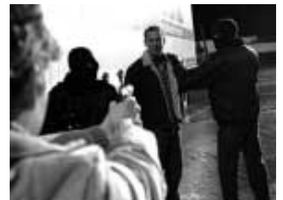
Tatort Ludwigshafen: W.W. Mohring fürchtet sich vorm schwarzen Mann

TATORT, Reihe - Berlin - Bremen - Frankfurt - Hamburg - Kiel - Köln - Konstanz - Leipzig - Ludwigshafen - München - Münster - Niedersachsen - Saarbrücken