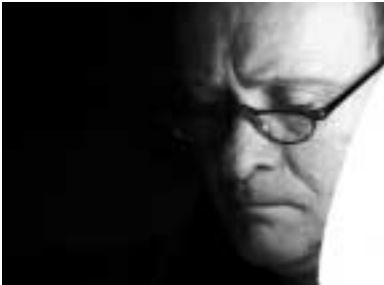
Schlechte Serien werden nicht alt